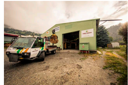
► Werkhof Saasermauer

Aufgrund des Wachstums des Forstreviers ist ein erneuter Umzug notwendig. Das neue «Zuhause» ist der Werkhof «Alte Saaser-Mauer» in Naters, ehemaliges Depot der Bauunternehmung Hans-Peter Salzmann.