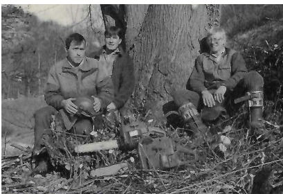
► 1991 - Einsatz zu Dritt

Mit dem Einzug in den neuen Werkhof «Bilderne» beginnt für Forst Massa ein neues Zeitalter. Gegründet am 10. Oktober 1989 von den Einwohner- und Bürgergemeinden Birgisch, Bister, Filet, Mörel und Naters, hat sich der Betrieb stetig weiterentwickelt und ist heute ein modernes Unternehmen mit 12 Angestellten, wovon 3 Lernende sind. Die wichtigsten Meilensteine der 37-jährigen Geschichte: