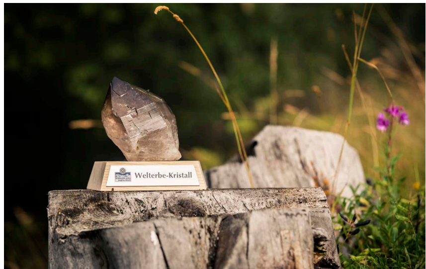
► Gewinn des Welterbe-Kristalls für die Aufwertungsarbeiten am Natischerberg

Das Managementzentrum des UNESCO-Welterbes Schweizer Alpen Jungfrau-Aletsch zeichnet das Projekt Aufwertung und Erhaltung der Natur- und Kulturlandschaft Natischerberg unter der Leitung von Forst Massa mit dem Welterbe-Kristall aus. Dieser wird jährlich an beispielhafte Projekte in der Welterbe-Region verliehen.