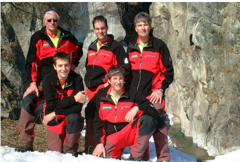
► Das Team von Forst Massa im Jahr 2006

Die Einwohner- und Bürgergemeinden Birgisch, Bister, Filet, Mörel und Naters schliessen sich im Zweckverband Forstrevier Massa zusammen.