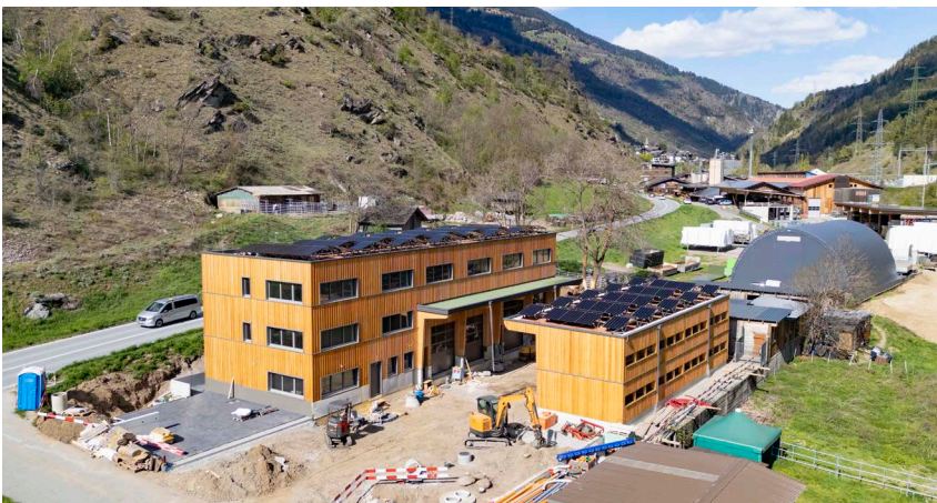
Der neue Werkhof «Bilderne» kurz vor der Fertigstellung

Ende Mai zieht Forst Massa von Naters in den neuen Werkhof «Bilderne» vor Mörel-Filet. Neben einer modernen Werkhalle werden im neuen Gebäude auch Büro und Lagerräumlichkeiten erstellt. Ein Maschinenunterstand bietet Platz, um den Fuhrpark von Forst Massa vor Witterungseinflüssen zu schützen. Forst Massa besitzt zudem geeignete Fahrzeuge für den Winterdienst, den BrennholzsERVICE und Gerätschaften um Umgebungsarbeiten und Spezialholzereien auszuführen.