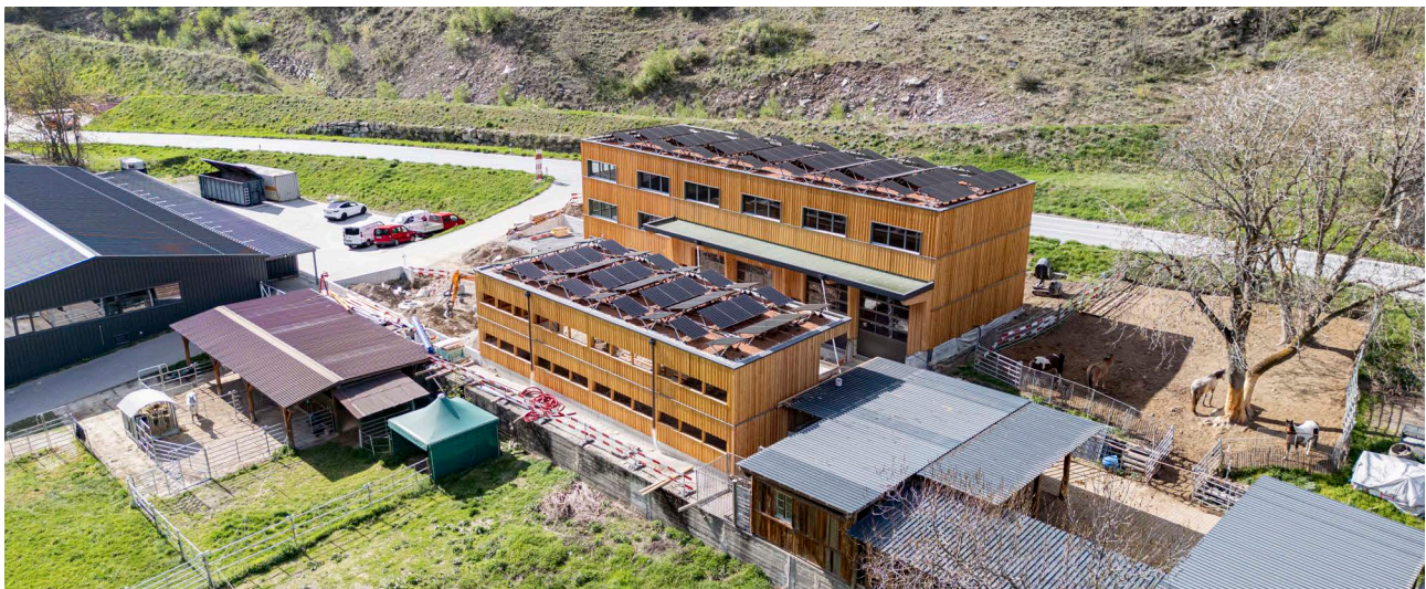
► Der Werkhof «Bilderne» kurz vor Abschluss der Arbeiten